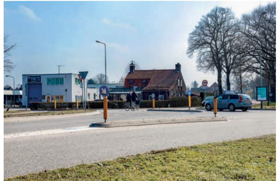
Huidige verkeerssituatie rondom de 'fantasiekruising' in Heijen.

De aanpassing van het kruispunt is geen onderdeel van de plannen om de haven in Heijen uit te breiden. Desondanks is er in Heijen de behoefte om de kruising op de korte termijn aan te pakken en dit zal parallel aan de havenuitbreiding plaats gaan vinden.