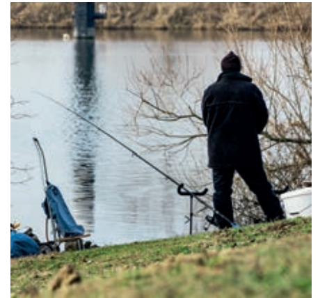
Visser langs de Maas.

van het gebied wordt rekening gehouden met de leefomgeving van de das.