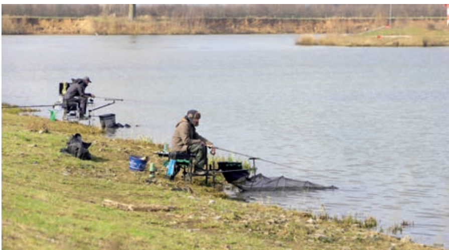
De visvereniging is blij dat in de uitbreidingsplannen de vismogelijkheden behouden blijven.