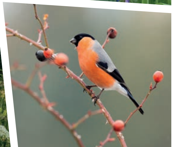
Meer ruimte voor natuur in de nieuwe plannen betekent meer biodiversiteit in het gebied.